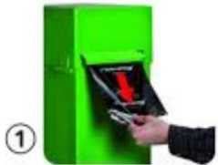
① Beutel gerade herausziehen

Die Gemeindeverwaltung sieht sich vermehrt mit Meldungen über fehlende Robidog-Säcke konfrontiert. Wir haben dies überprüft. Die Robidog-Behälter werden i.d.R. einmal wöchentlich durch das Gemeindewerk geleert und mit Robidog-Säcken aufgefüllt. Dabei wurde aber festgestellt, dass die einzelnen Säcke nicht immer sauber abgerissen werden, so dass diese oft zurück in die Box fallen. Wir bitten Sie deshalb, beim Abreißen der Beutel zu beachten: