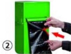
② Oben halten, Unten abreißen

Auch wird vermehrt festgestellt, dass die Hundetoiletten als Abfallkübel missbraucht werden (Katzenstreu usw.). Wir bitten Sie, ihren Hauskehricht ordnungsgemäss zu entsorgen. Wir danken Ihnen für Ihre Mithilfe.