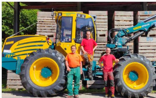
Bild: Forstspezialschlepper HSM

Anfangs Juni 2021 durfte die Gemeinde Benken als Kopfbetrieb des Forstrevieres Cholfirst den neuen Spezialforstschelepper HSM in Empfang nehmen.