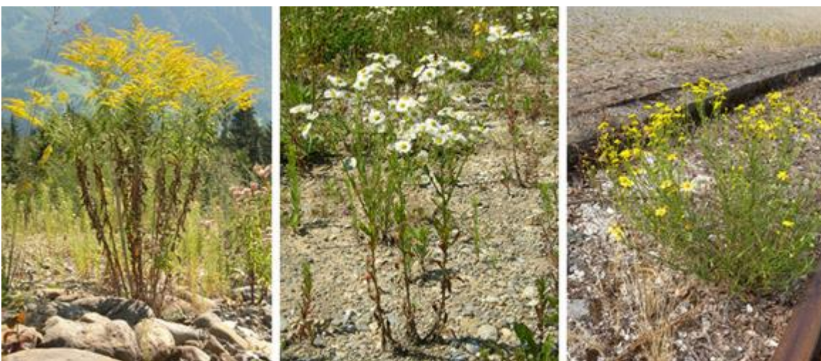
Abbildung: Ein Ausschnitt von Neophyten in Benken: nordamerikanische Goldrute, einjähriges Berufskraut, schmalblättriges Greiskraut (v.l.)

Weitergehende Informationen finden Sie unter: www.neobiota.zh.ch . Fragen zur Bekämpfung oder zu weiteren Neophyten beantwortet Ihnen gerne das Gemeindewerk Benken, Tel. 079 801 15 68.