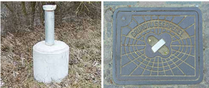
Abbildung 2: Beispielfotos für Grundwassermessstellen (überstehender und ebenerdiger Ausbau)

Auswertungen vorliegen, mit zusätzlichen Messstellen ergänzt. Insgesamt wird von 10 bis 15 Messstellen ausgegangen. In den fertig eingerichteten Grundwassermessstellen werden Messungen zum Grundwasserstand und zur Grundwasserflussrichtung sowie zur Permeabilität (Durchlässigkeit) durchgeführt.