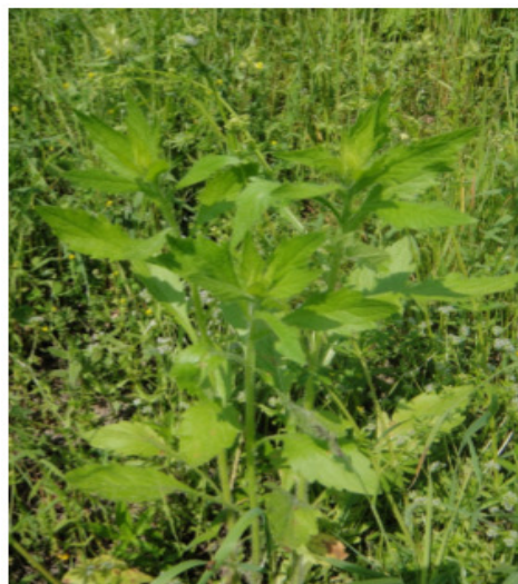
Berufkraut vor der Blüte