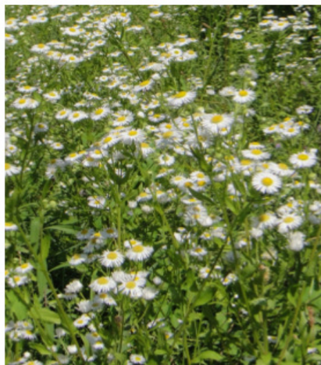
Blühendes Berufkraut