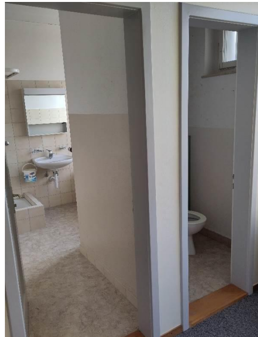
Altes Schulhaus 1. OG: Badzimmer und WC (Ist-Zustand)