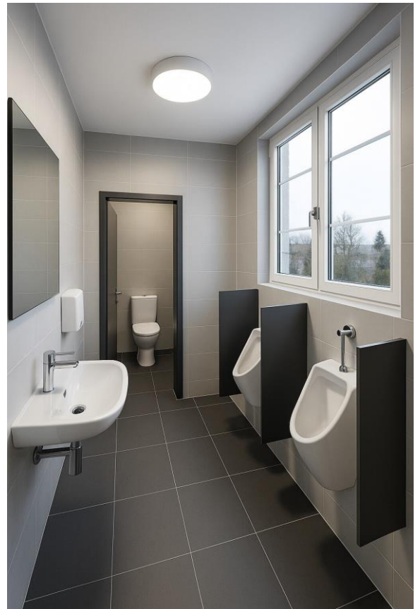
Altes Schulhaus EG: WC-Anlagen Knaben neu (Skizze)