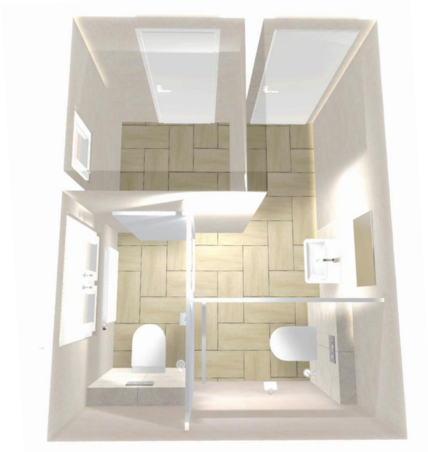
Altes Schulhaus 1. OG: WC-Anlagen neu (Skizze)