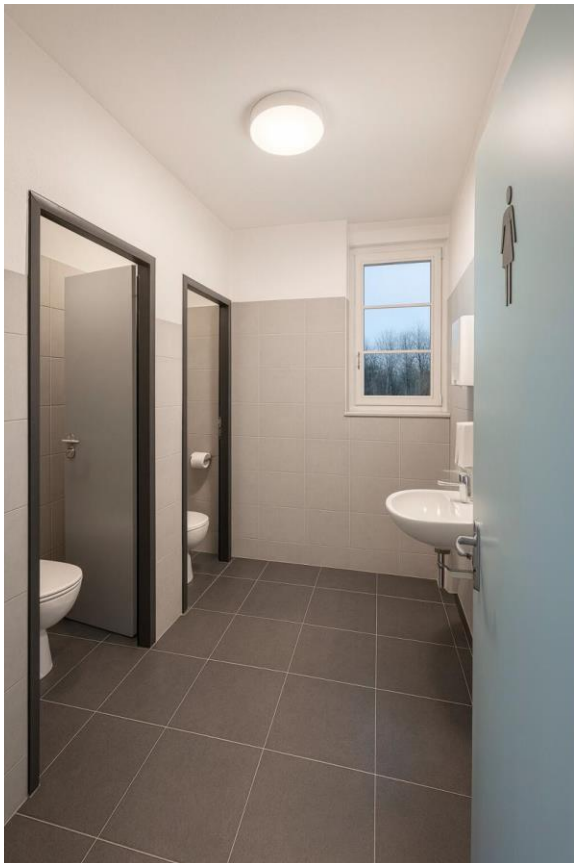
Altes Schulhaus EG: WC-Anlagen Mädchen neu (Skizze)