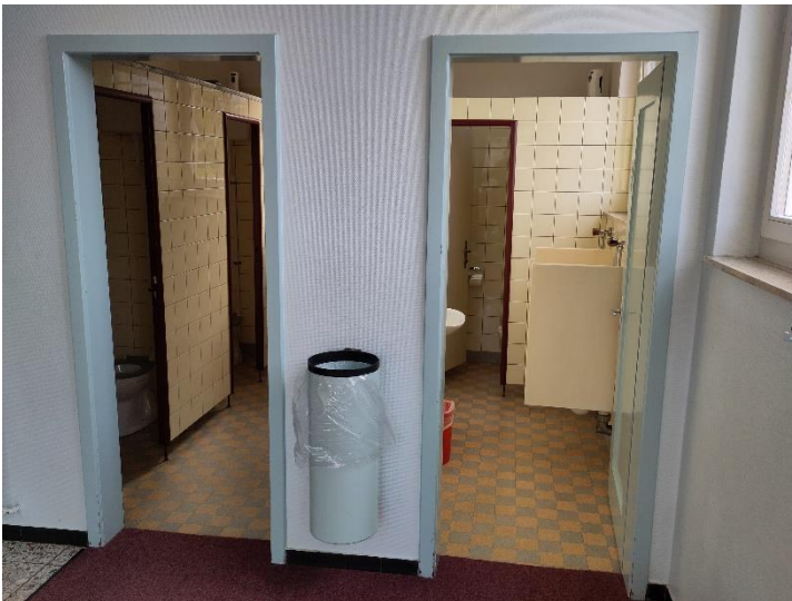
Altes Schulhaus EG: WC Anlagen Mädchen und Knaben (Ist-Zustand)

Auf beiden Etagen sollen defekte und veraltete Leitungen erneuert werden. Proben haben ergeben, dass mit einer Asbestsanierung zu rechnen ist.