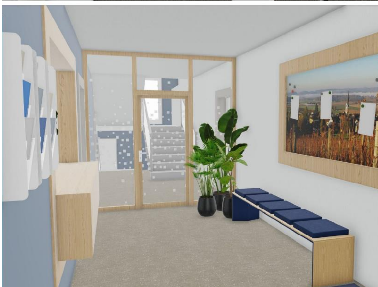
Gemeindehaus: Grobe Visualisierungen Büro und Schalterbereich (Entwürfe)