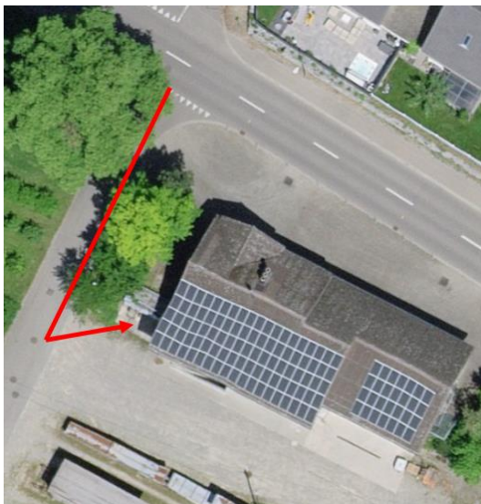
Bild: Werkgebäude, Standort neue Sammelstelle