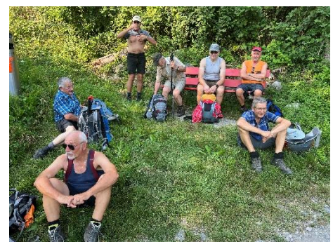
Spitzengruppe vor Quinten