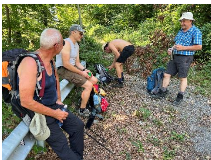
Pause im Flachstück