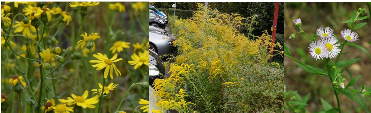
Abbildung: Ein Ausschnitt von Neophyten in Benken: Schmalblättriges Greiskraut, Amerikanische Goldruten, einjähriges Berufskraut (v.l.)

Weitergehende Informationen finden Sie unter: www.neobiota.zh.ch . Fragen zur Bekämpfung oder zu weiteren Neophyten beantwortet Ihnen gerne das Gemeindewerk Benken, Tel. 079 801 15 68.